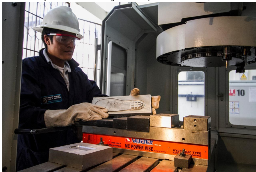
Figura 13: Laboratorios y Talleres Facultad de Ingeniería Civil y Mecánica

Elaborado por: Universidad Técnica de Ambato Fuente: Universidad Técnica de Ambato