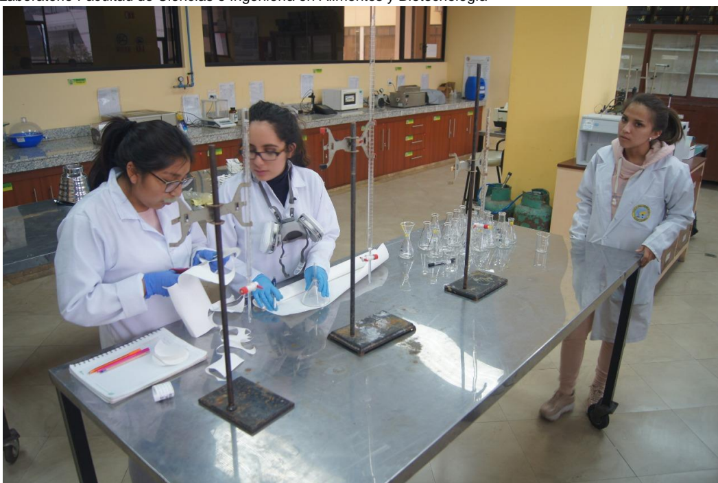
Figura 8: Laboratorio Facultad de Ciencias e Ingeniería en Alimentos y Biotecnología

Elaborado por: Universidad Técnica de Ambato Fuente: Universidad Técnica de Ambato