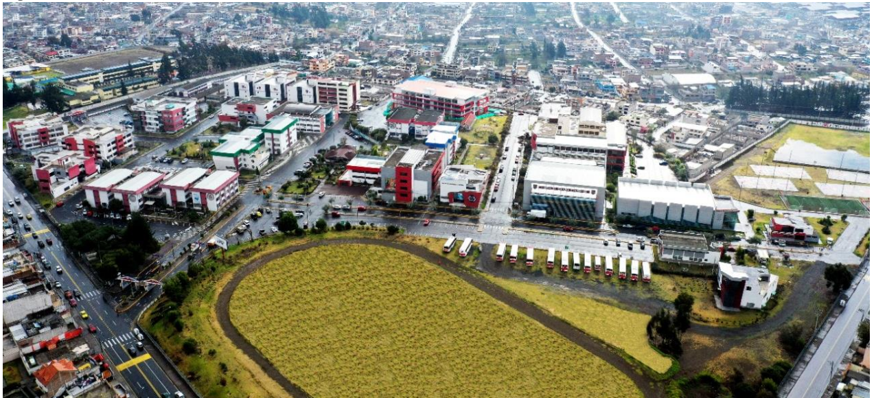
Figura 1: Campus Huachi

Elaborado por: Universidad Técnica de Ambato Fuente: Universidad Técnica de Ambato