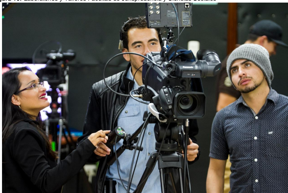
Figura 16: Laboratorios y Talleres Facultad de Jurisprudencia y Ciencias Sociales

Elaborado por: Universidad Técnica de Ambato