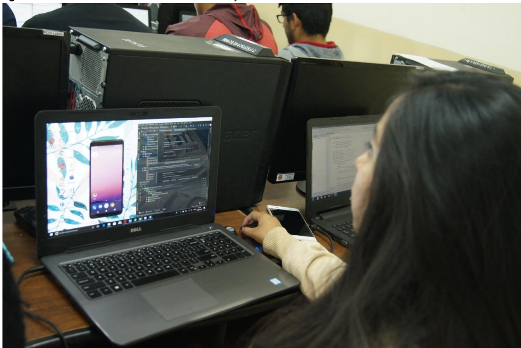
Figura 11: Laboratorios Facultad de Contabilidad y Auditoría

Elaborado por: Universidad Técnica de Ambato Fuente: Universidad Técnica de Ambato