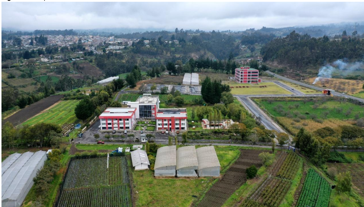
Figura 3: Campus Querochaca

Elaborado por: Universidad Técnica de Ambato