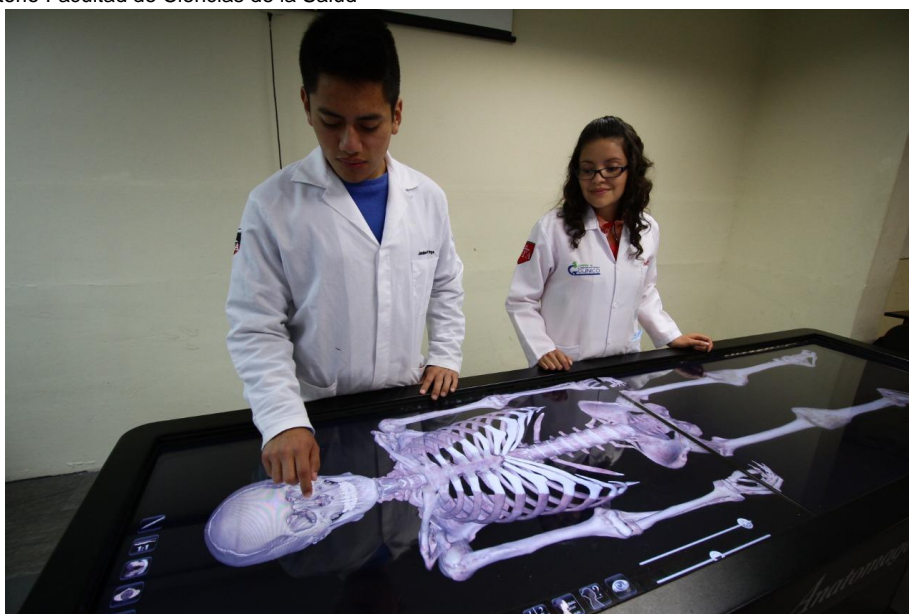
Figura 7: Laboratorio Facultad de Ciencias de la Salud

Elaborado por: Universidad Técnica de Ambato Fuente: Universidad Técnica de Ambato