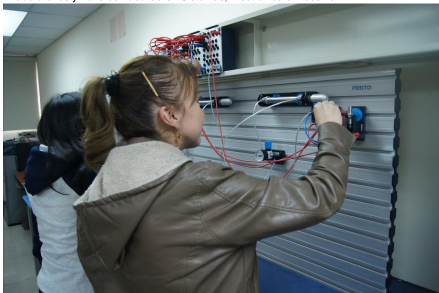
Figura 14: Laboratorios y Talleres Facultad en Sistemas, Electrónica e Industrial

Elaborado por: Universidad Técnica de Ambato Fuente: Universidad Técnica de Ambato