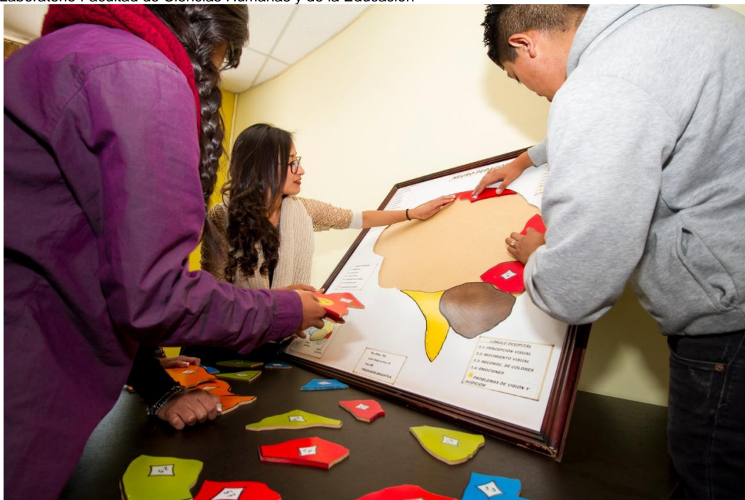
Figura 9: Laboratorio Facultad de Ciencias Humanas y de la Educación

Elaborado por: Universidad Técnica de Ambato Fuente: Universidad Técnica de Ambato