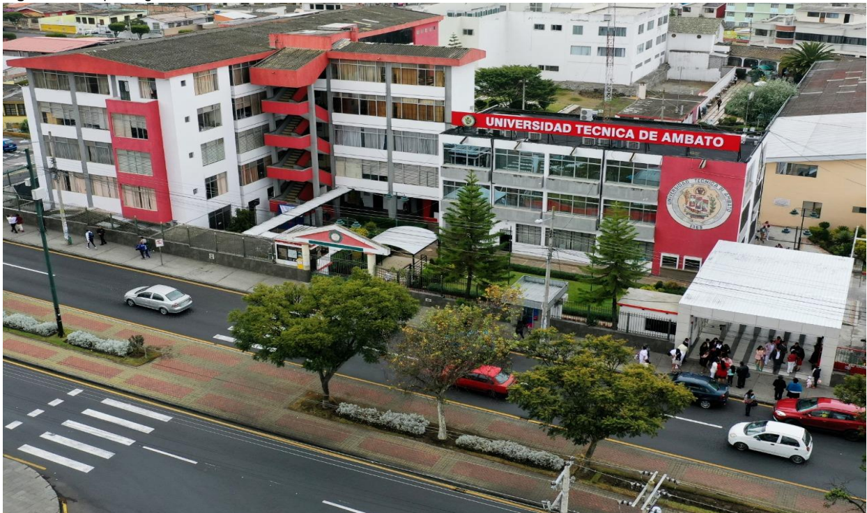
Figura 2: Campus Ingahurco

Elaborado por: Universidad Técnica de Ambato