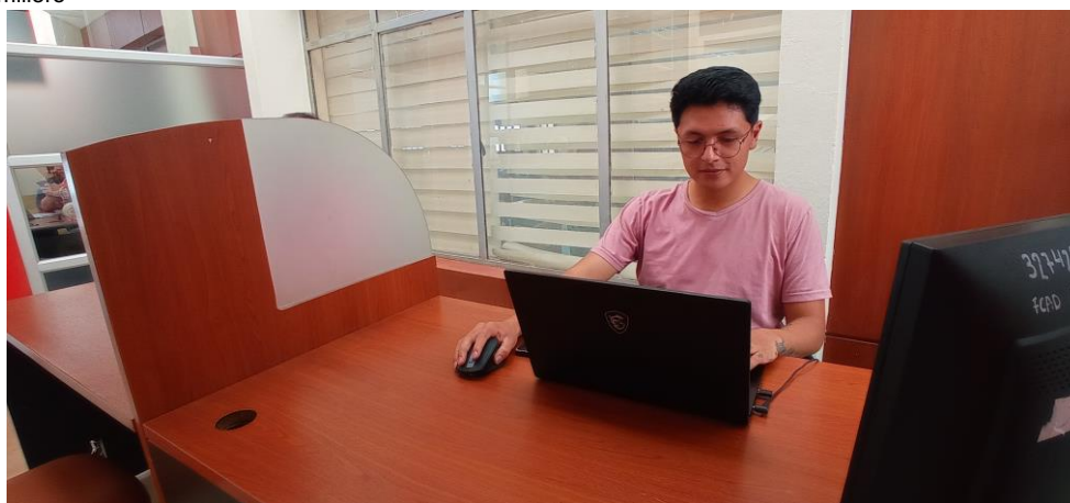
Figura 18: Semillero

Elaborado por: Universidad Técnica de Ambato