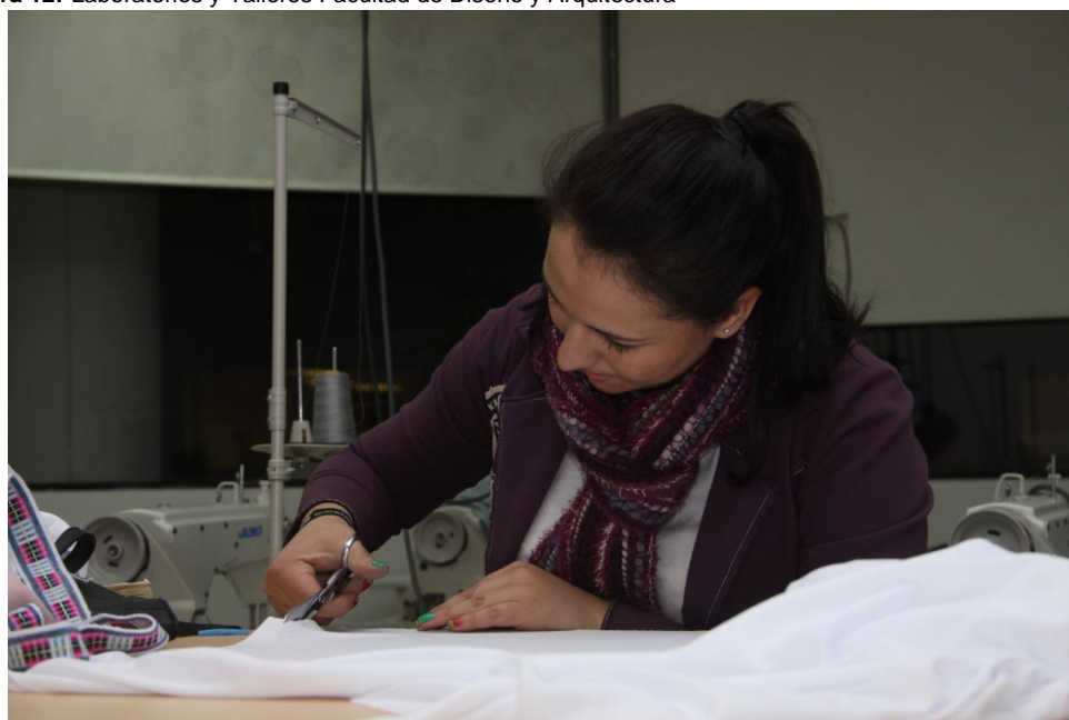
Figura 12: Laboratorios y Talleres Facultad de Diseño y Arquitectura

Elaborado por: Universidad Técnica de Ambato