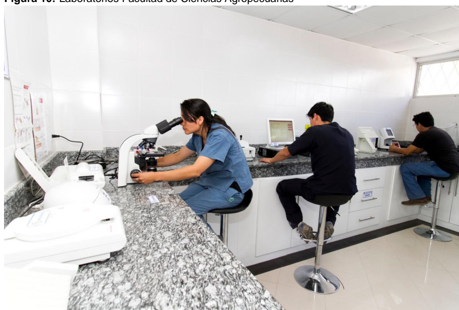
Figura 10: Laboratorios Facultad de Ciencias Agropecuarias

Elaborado por: Universidad Técnica de Ambato Fuente: Universidad Técnica de Ambato