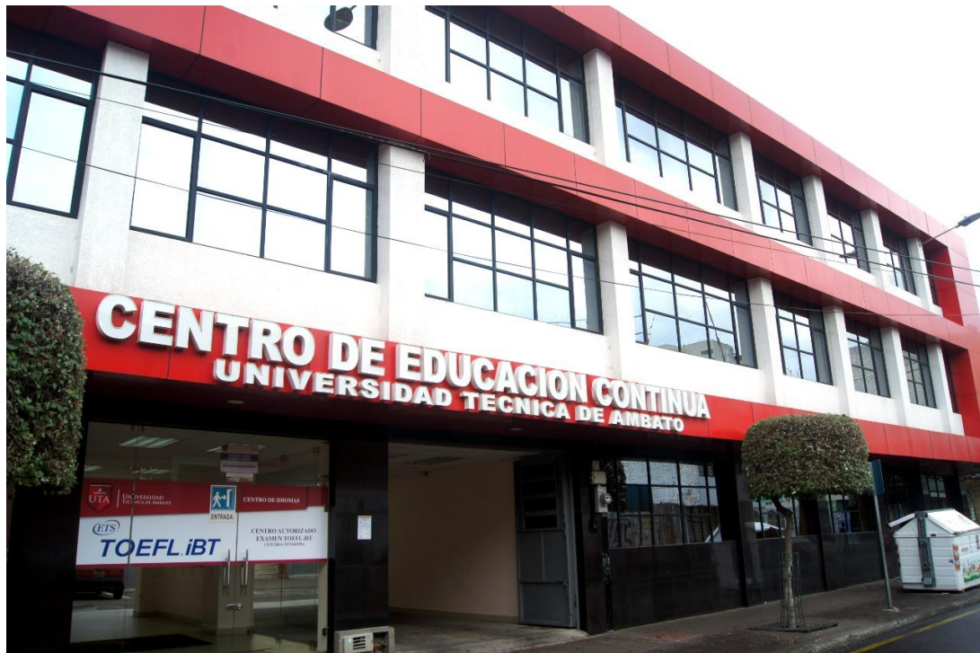
Figura 5: Centro de Educación Continua

Elaborado por: Universidad Técnica de Ambato