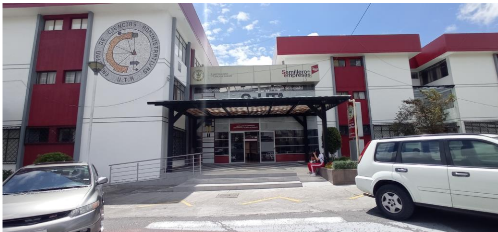
Figura 17: Semillero

Elaborado por: Universidad Técnica de Ambato