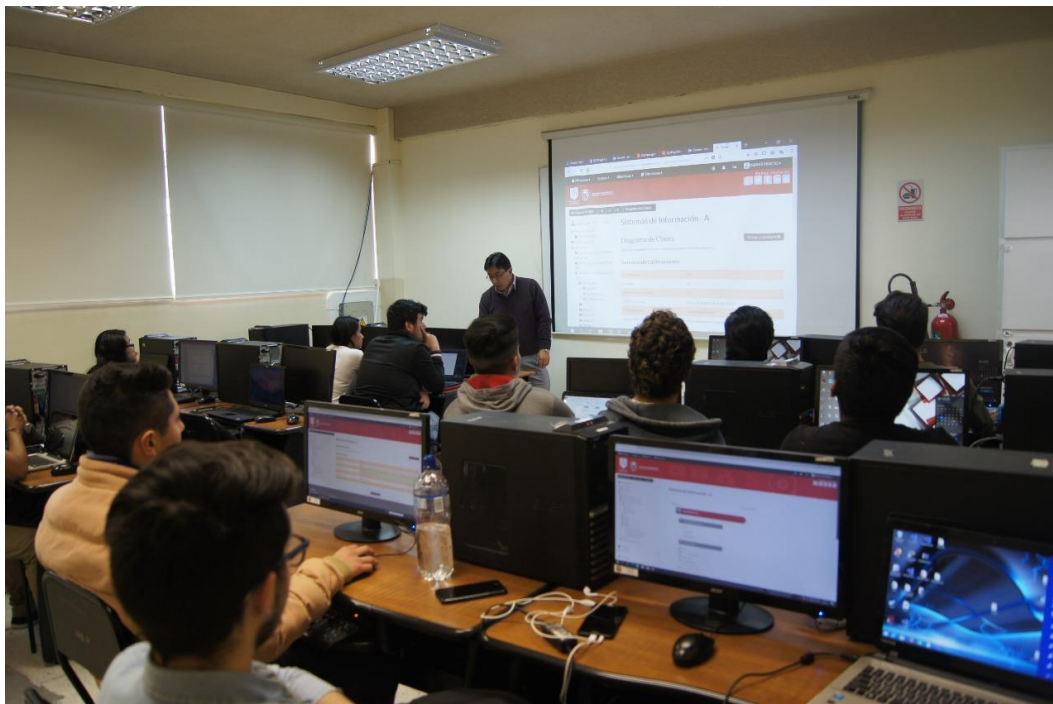
Figura 6: Laboratorios Facultad de Ciencias Administrativas

Elaborado por: Universidad Técnica de Ambato Fuente: Universidad Técnica de Ambato