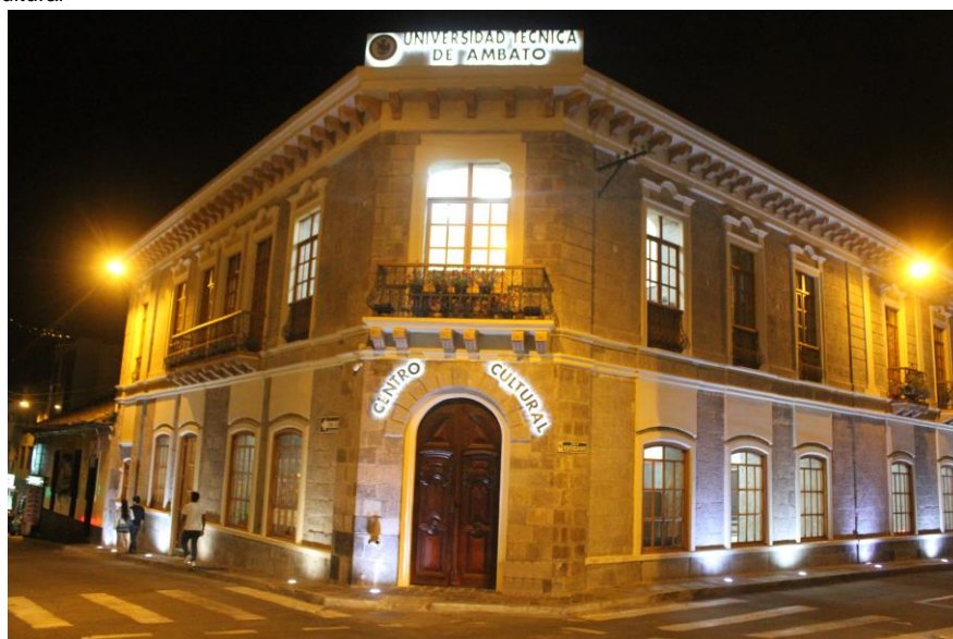
Figura 4: Centro Cultural

Elaborado por: Universidad Técnica de Ambato