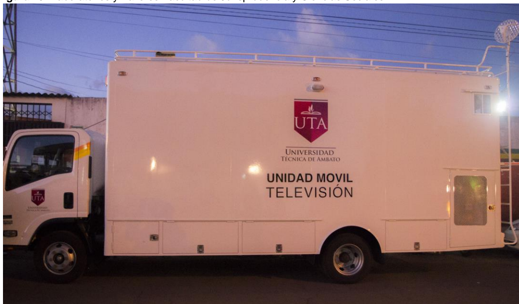
Figura 15: Laboratorios y Talleres Facultad de Jurisprudencia y Ciencias Sociales

Elaborado por: Universidad Técnica de Ambato